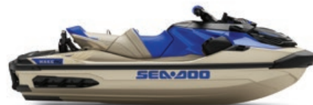
● Sable et Bleu Éclatant