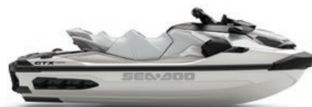
○ Blanc perlé haut de gamme