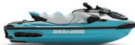
● Turquoise métallique