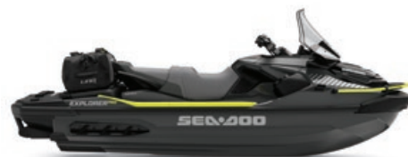
● Gris Islande