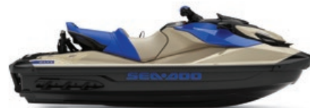
Sable et Bleu Éclatant