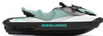
Blanc et Néo menthe