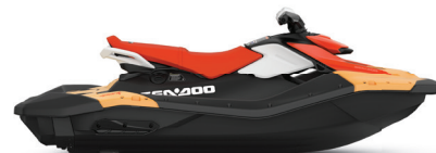
Orange aurore et Rouge dragon