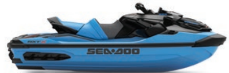
NOUVEAU Bleu océan haut de gamme