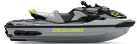
Glace métallique et Vert mante