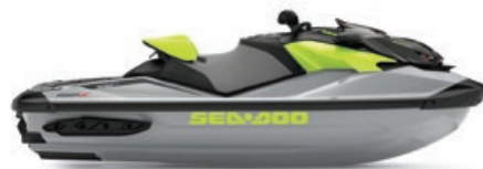
Glace métallique et Vert mante