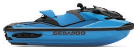
NOUVEAU Bleu océan haut de gamme