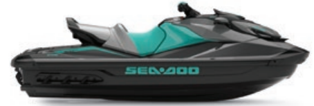
● Noir éclipse et Bleu récif