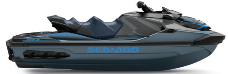
Blue Abyss y Gulfstream Blue