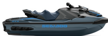
Blue Abyss and Gulfstream Blue