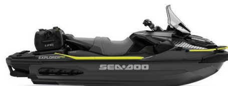
● Iceland Grey