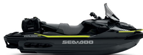
● Iceland Grey