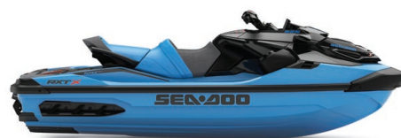
● NEW Gulfstream Blue Premium