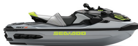
● Ice Metal and Manta Green