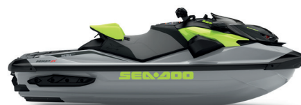
● Ice Metal and Manta Green