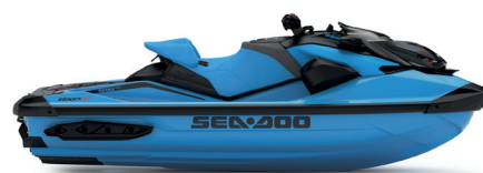
● NEW Gulfstream Blue Premium