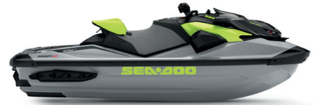
● Ice Metal and Manta Green