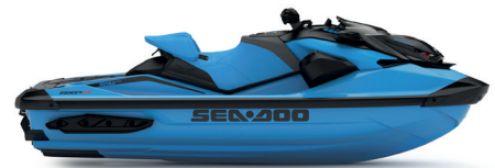
● NEW Gulfstream Blue Premium