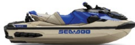
● サンド/ダズリングブルー