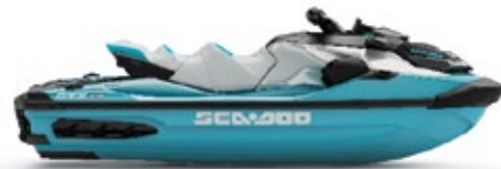
● ティールメタリック