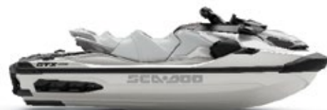
○ ホワイトパールプレミアム