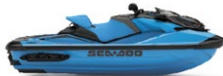
● NEW ガルフストリーム ブルー プレミアム