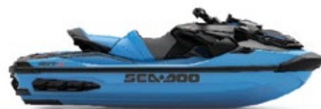
● NEW ガルフストリーム ブルー プレミアム