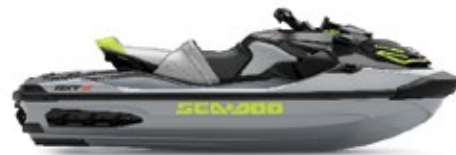
● アイスメタル/マンタグリーン