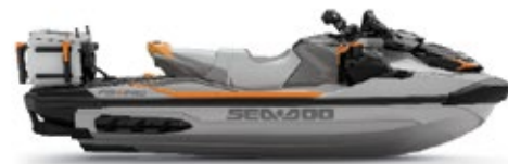
シャークグレー/オレンジクラッシュ