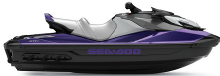
● NOUVEAU Mauve minuit