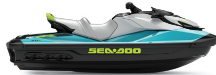
● Bleu turquoise et Vert mante