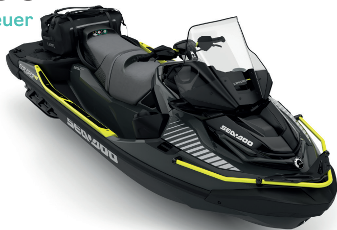
● Iceland Grey