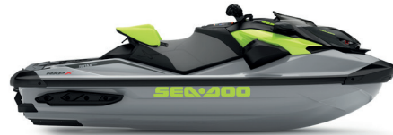
Ice Metal and Manta Green