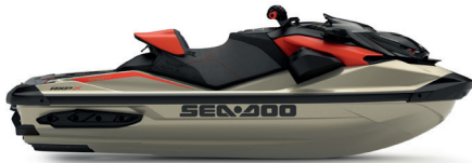
NEW Metallic Tan and Lava Red Premium