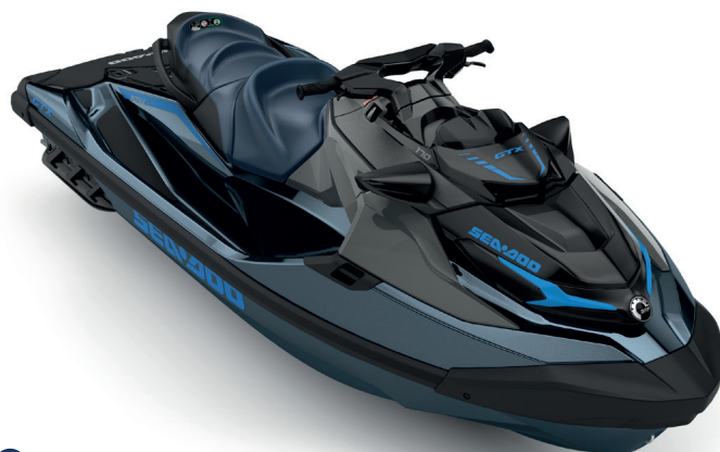
Blue Abyss / Gulfstream Blue