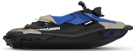
● 新沙黄色 + 炫目蓝