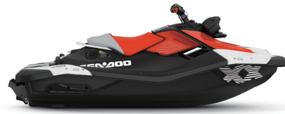
● 火龙红 + 亮白色