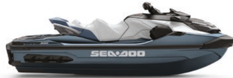
● Blue Abyss