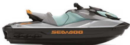
GTI™ SE 170