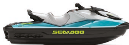
GTI™ SE 170