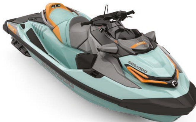
● Neo Mint