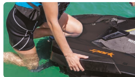
Bordningssteg (tillval) För lättare och snabbare ombordstigning från vattnet.