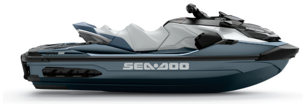
● NUEVO Blue Abyss