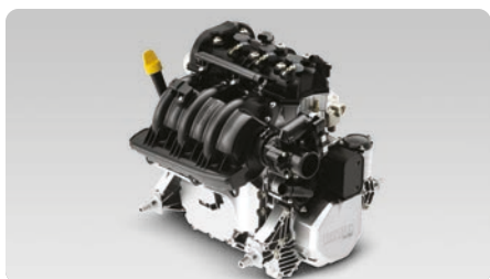
Motori Rotax® 900 ACE™ – 60 / 90 Due opzioni di motore Rotax leggeri, compatti e dai consumi ridotti.