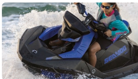
Scafo Spark® Il design dello scafo Spark offre una piattaforma leggera e divertente. L'innovativo materiale Polytec™ riduce ulteriormente il peso ottimizzando allo stesso tempo prestazioni ed efficienza. La colorazione nello stampaggio è più resistente ai graffi rispetto alla fibra di vetro.