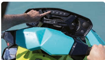
Audio BRP – Sistema portatile (opzionale) Sistema audio portatile Bluetooth † , da 50 Watt, impermeabile e di alta qualità.