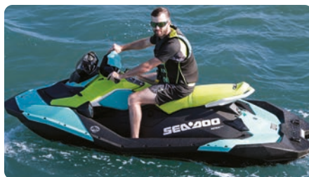
Sella stretta Progettata per migliorare la libertà di movimento durante l'utilizzo.