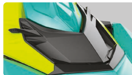
Kit per gavone di prua (opzionale) Ulteriore spazio di carico per portare più attrezzatura a bordo.