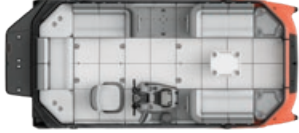
SWITCH CRUISE 18 - 170