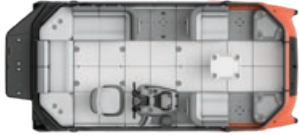
SWITCH CRUISE 18 - 130