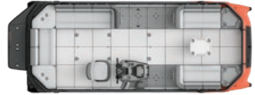
SWITCH CRUISE 21 - 170