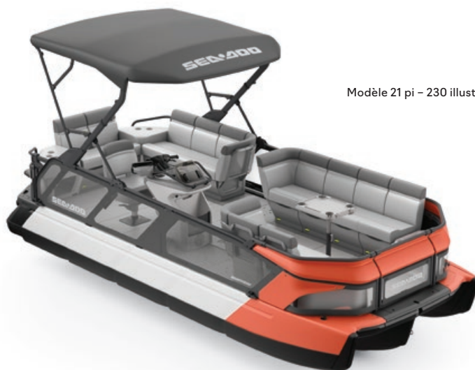
Modèle 21 pi – 230 illustré