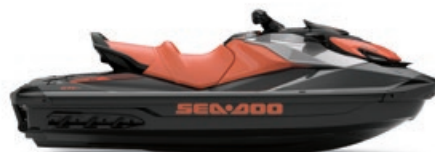
GTI MC SE 130

● NOUVEAU Glace métallique et néo menthe