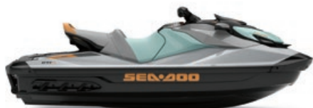
GTI MC SE 170

● NOUVEAU Glace métallique et néo menthe